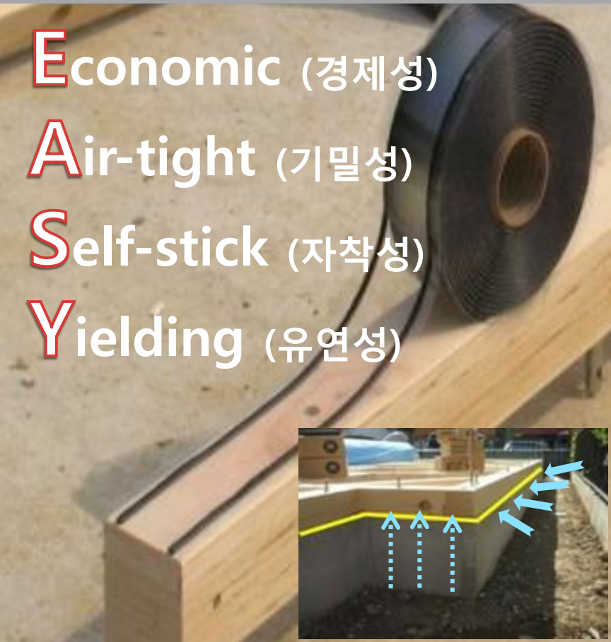
파운데이션 가스켓 구조